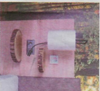
Nicht nur auf der Fototapete zeigt sich das Motto, überall findet sich Holz als Gestaltungselement.

hinter dem Bett für Wohlfühlambiente, überall findet sich Holz als Gestaltungselement und gepflückte Wildkräuter aus dem Schweizer Wald runden den Eindruck ab.